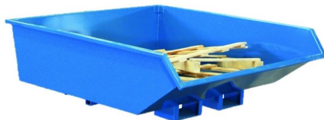
Bennes d'atelier surbaissées auto-basculantes, de 550 à 900 L.