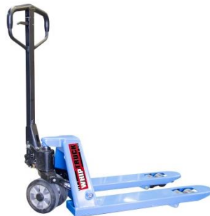
Fourche 800 mm