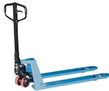
Surbaissé 54 mm