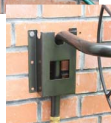
Autre position d'utilisation