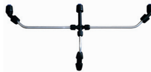
Réf 603 003 Rampe 3 buses