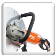
Poignée et capot ajustables