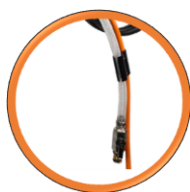
Raccord d'eau Gardena