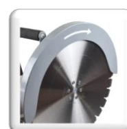
Carter coupe A ras de mur