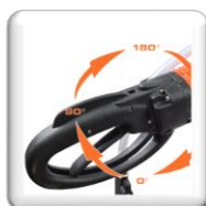
Poignet pivotante sur 360° pour une meilleure ergonomie