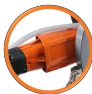
Moteur robuste de 3300 W