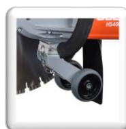
Rouleaux de soutien larges, guidage précis