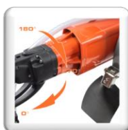
Protection anti éclaboussures