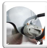
Carter de protection robuste en métal