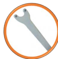
Clé de serrage (Inclus)

Scie électrique coupe sous arrosage, Profondeur de coupe 162 mm, la découpeuse pour les professionnels du BTP