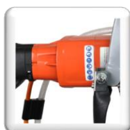
Moteur électrique 220 V, Puissance 3,3 Kw