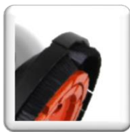
Capot bordureur «ras de mur»