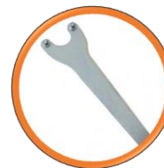
Clé de serrage (Inclus)

Ponceuse compacte et universelle Motorisation 230 V pour le ponçage de sols béton, pierre naturelle et terrazzo jusqu'à 200 m Ponceuse portable robuste et ergonomique idéale pour petites et moyennes surfaces Ponçage - lissage - nettoyage.