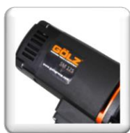
Moteur électrique 220 V, Puissance 1,8 Kw