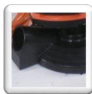
Entrée d'aspiration Raccord d'aspirateur