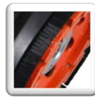
Taquet d'arrêt facilitant le changement de plateau