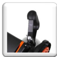
Poignée avant réglable en hauteur