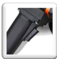
Démarrage électronique progressif