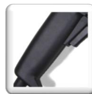
Poignée à étrier anti-vibrations