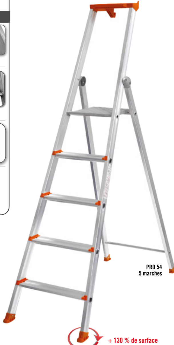
PRO 54 5 marches

Testé dans les conditions définies par le paragraphe 5.8 de la norme EN 131.