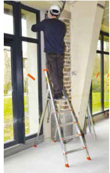
PRO 54 - 5 marches