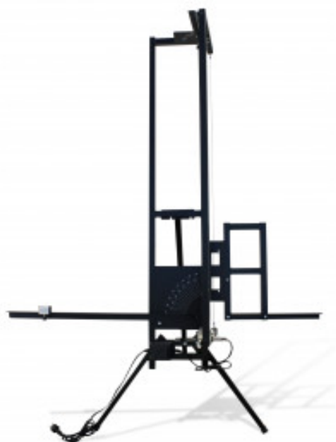
TABLE DE DÉCOUPE AU FIL CHAUD - Pour polystyrène, spécial I.T.E.

Réf. : 266555 Gencod 3476060026651 / Poids 27.000 kg PCB : 1 / Métier : Facadier