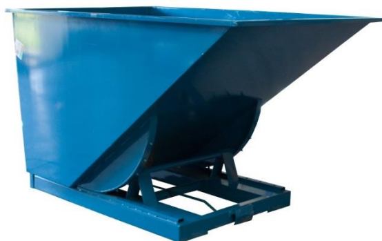
Bennes d'atelier auto-basculantes, de 150 à 3000 L.