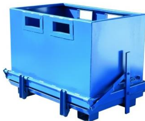
Bennes d'atelier à fond ouvrant, de 700 à 1800 L.