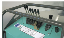
Console de commandes