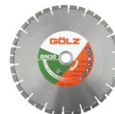
GN30 Granit Prémium - brasé