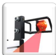
Indicateur de coupe laser