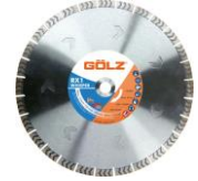
RX1 Gamme Excellence