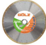
SlimFast Gamme Excellence