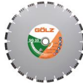
SG35 Granit Turbo Prémium