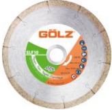
SLF10 Gamme Technique

Nous recommandons l'utilisation de nos disques diamantés pour votre MS350 A ML.