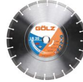
LB20 Universel Basic