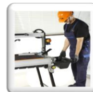
Bac à eau amovible pour entretien facile