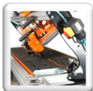
Coupe biseau 45°