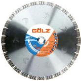
Whisper RX1 Gamme Excellence