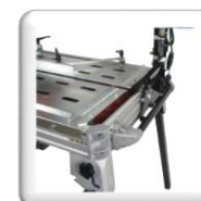
Poignée de transport