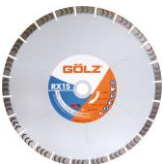
RX1S Gamme Excellence