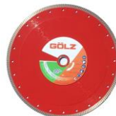
SF30 Gamme Excellence