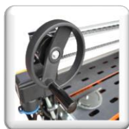
Avance tête de coupe par commande volant