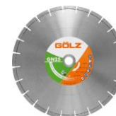
GN25 Granit Standard