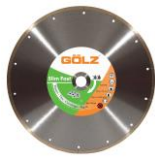
SLF20 Gamme Prémium