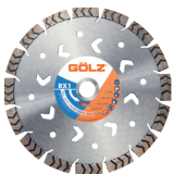
RX1 Gamme Excellence