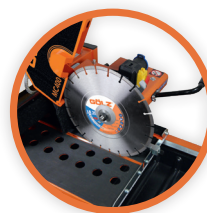
Disque de coupe facile à remplacer

Plus que le standard, la solution pour tous vos chantiers ! Table de coupe extra large, transport facile, coupe biseau 45°, plus de profondeur de coupe