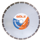
RX1S Gamme Excellence