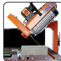
Coupe biseau 45°