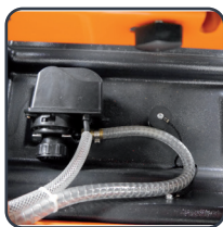
Pompe à eau