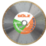
SLF20 Gamme Prémium