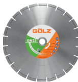
GN25 Granit Gamme Standard