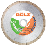
SLF10 Gamme Technique

Nous recommandons l'utilisation de nos disques diamant pour votre MC400