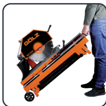
Poignée et roues de transport