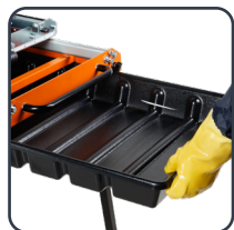
Bac à eau amovible