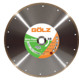
Slimfast Gamme Excellence