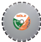
SG35 Granit Turbo Gamme Prémium