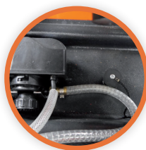
Pompe à eau électrique