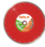
SF30 Gamme Excellence