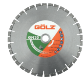
GN30 Granit Gamme Prémium