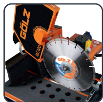
Disque de coupe facile à remplacer