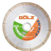
SLF10 Gamme Technique

Nous recommandons l'utilisation de nos disques diamantés pour votre TS200.