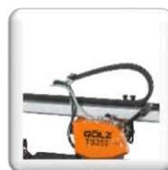
Avec sa chaîne de protection pour les câbles électriques et la durite d'eau