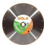
SLF20 Gamme Prémium