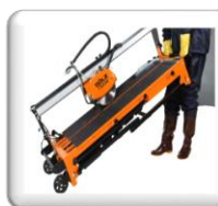
Roues de transport