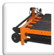
Transport Facile Avec ses 2 poignées