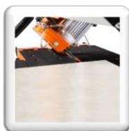
Coupe biseau 45°