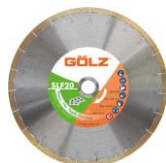
SlimFast Gamme Excellence