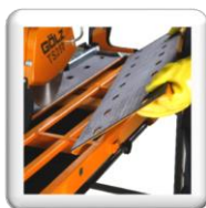
Table de coupe facile d'entretien