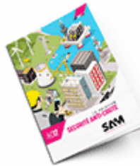
Sécurité anti-chute 2017 Consulter le catalogue