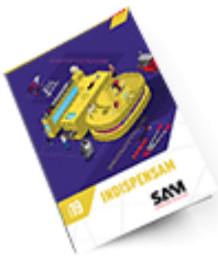
Les outils Indispensables SAM 2019 Consulter le catalogue