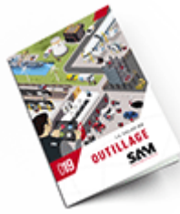
Outillage 2019 Consulter le catalogue