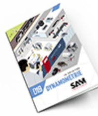
Dynamométrie 2019 Consulter le catalogue