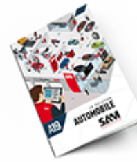
Automobile 2019 Consulter le catalogue