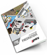
Pneumatique 2019 Consulter le catalogue