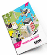
Sécurité anti-chute SAM 2017 Consulter le catalogue