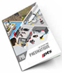
Pneumatique SAM 2019 Consulter le catalogue