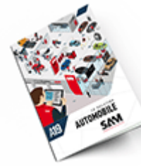
Automobile SAM 2019 Consulter le catalogue