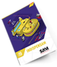
Les outils Indispensables SAM 2019 Consulter le catalogue