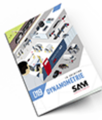
Dynamométrie SAM 2019 Consulter le catalogue