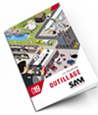
Outillage SAM 2019 Consulter le catalogue