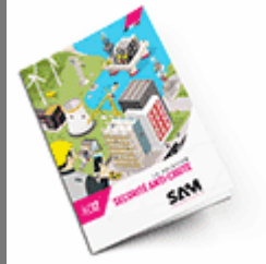
Sécurité anti-chute SAM 2017