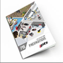
Pneumatique SAM 2019