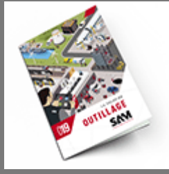
Outils SAM 2019