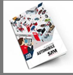
Automobile SAM 2019