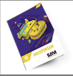
Les outils Indispensables SAM 2019