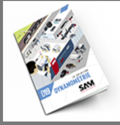
Dynamométrie SAM 2019