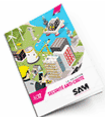
Sécurité anti-chute 2017