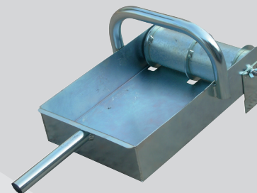
Pour le collage des blocs béton rectifiés