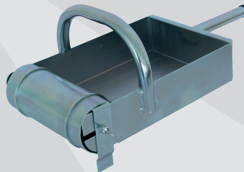
Pour le collage des briques Monmur