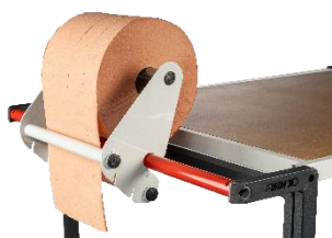
Dévidoir 882 006 152 Pour rouleaux Ø 300 mm maxi.