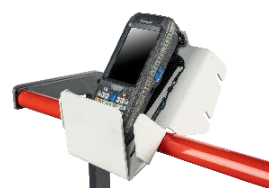
Porte-douchette 882 006 149