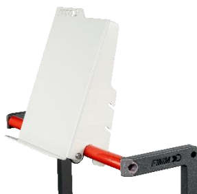
Porte-documents format portrait A4 882 006 150