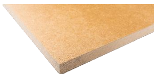
Plateau bois médium