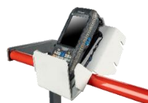
Porte-douchette 882 006 149