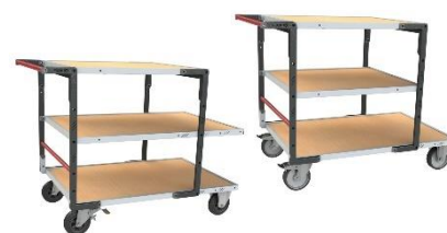
Différentes combinaisons de plateaux