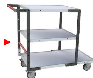
Barre de maintien Évite la chute d'objets Plateaux taille S : 802 000 017 Plateaux taille M : 802 000 018 Plateaux L : 802 000 019