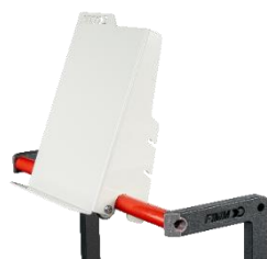
Porte-documents format portrait A4 882 006 150