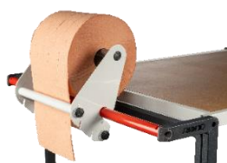
Dévidoir 882 006 152 Pour rouleaux Ø 300 mm maxi.