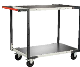
Plateau tôle galva