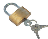
Cadenas laiton 30 mm fourni avec 3 clés Réf. CL30