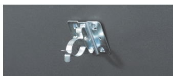
Clips pour fixation outils à manche dans le couvercle Réf. 705513