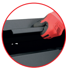
Poignée d'ouverture sur toute la longueur