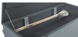
Support galva pour outils longs Réf. SUPGTP