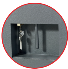
Cadenas encastré inviolable fourni