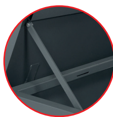
Barre de maintien ouverture couvercle