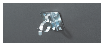
Clips pour fixation outils à manche dans le couvercle Réf. 705513