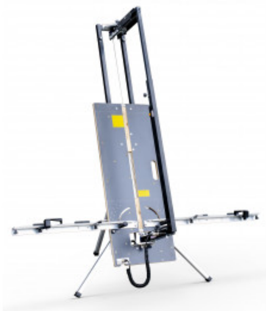
TABLE DE DÉCOUPE AU FIL CHAUD DÉPLIABLE - Pour polystyrène, spécial I.T.E.

Réf. : 367155 Gencod 3476063671551 / Poids 29.300 kg PCB : 1 / Métier : Facadier