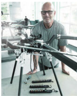
Les sangles porte-outils Wera