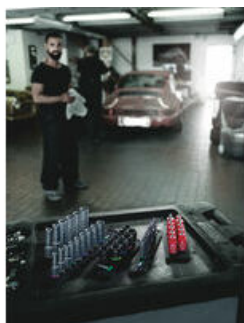
Les sangles porte-outils Wera