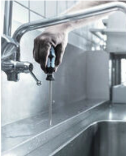
L'inox se visse avec de l'inox !