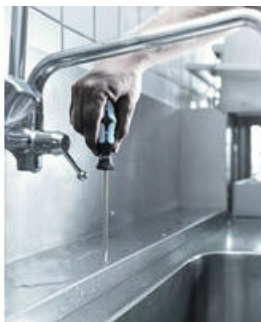
L'inox se visse avec de l'inox !