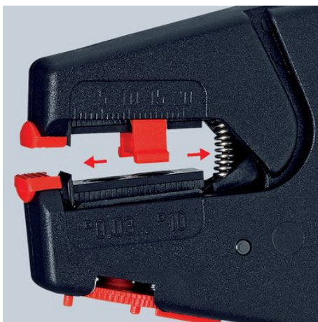
12 40 200: Butée longitudinale réglable

Sous réserve de toute modification technique et erreur.