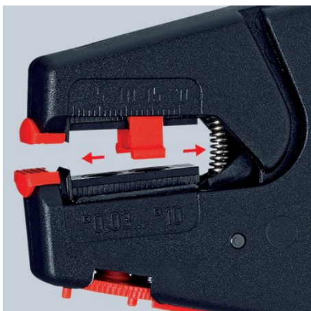
12 40 200: Butée longitudinale réglable

Sous réserve de toute modification technique et erreur.