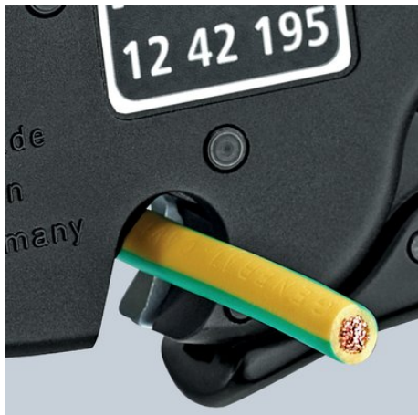
Coupe-fils pour fils multifilaires jusqu'à 10,0 mm 2

Mâchoires en acier empêchant le câble de glisser