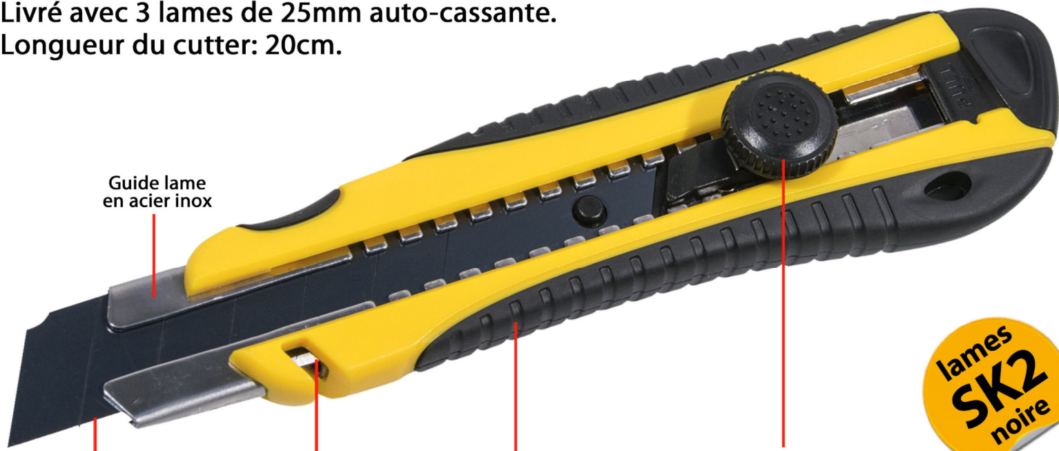
Guide lame en acier inox