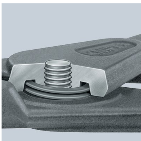
Ressort intégré: le ressort est protégé à l'intérieur de la charnière de précision vissée. Ne gêne pas pendant le travail, pas d'encrassement ni de perte