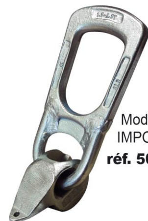
Modèle IMPORT réf. 5030