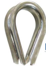
INOX AISI 316 Réf. 5087