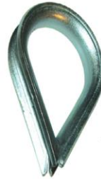
GRANDE OUVERTURE Acier galvanisé Réf. 5082