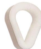
NYLON Réf. 5085