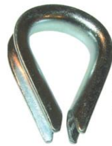
PETITE OUVERTURE Acier galvanisé Réf. 5080