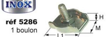
réf 5286 1 boulon