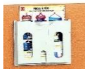
802 000 001 Porte document plastique autocollant