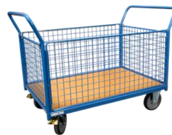
2 dossiers + 2 ridelles