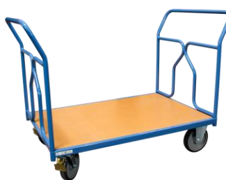
2 dossiers + 1 ridelle