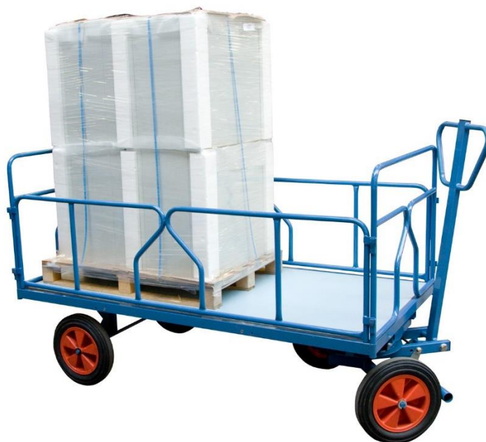
2 dossiers + 2 ridelles tube amovibles