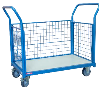
2 dossiers + 1 ridelle