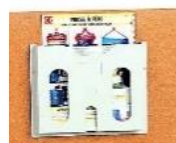
802 000 001 Porte document plastique autocollant