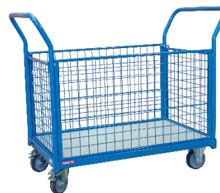
2 dossiers + 2 ridelles