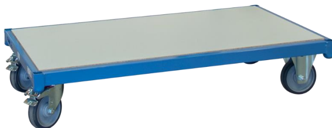
800 008 452 Plateau BOIS