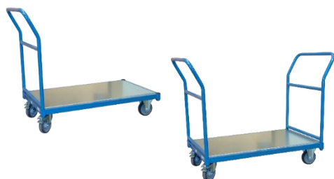
1 ou 2 dossiers