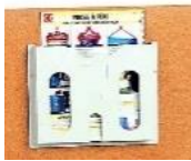
802 000 001 Porte document plastique autocollant