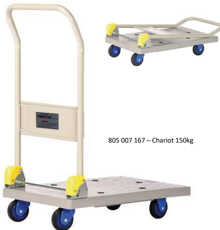
805 007 167 – Chariot 150kg