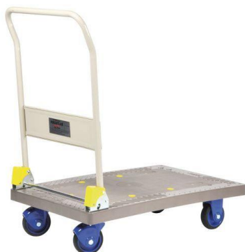
805 007 168 – Chariot 300kg