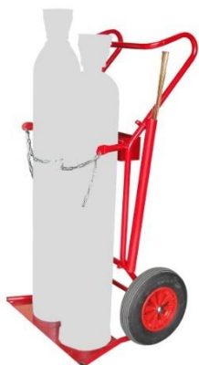
812 007 959 – Fourreau pour baguettes de soudure 700mm de long, Ø 45mm