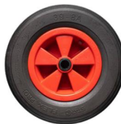
812 009 488 – Roues increvables Roulage optimisé jusqu'à 200 kg