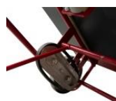
Système de type chenille pour franchir les marches en appui