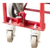
Roues Ø 200 mm sur corps en fonte d'aluminium montées sur roulement à billes