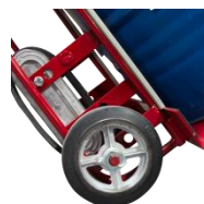
Béquille de soutien escamotable