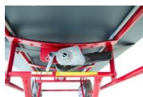
Rembobinage automatique de la sangle