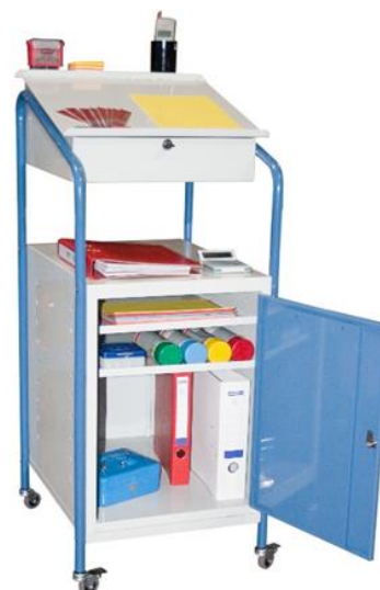
820 005 970 avec option 882 006 037