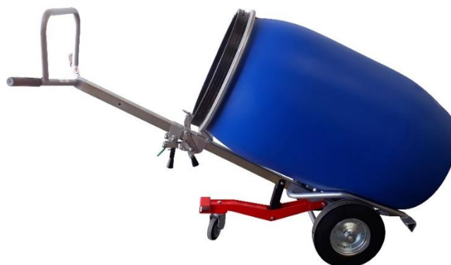
845 008 013 – Double griffe