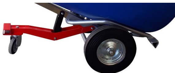
Béquille avec amortisseur