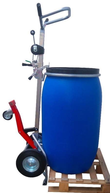
845 008 014 – Double griffe