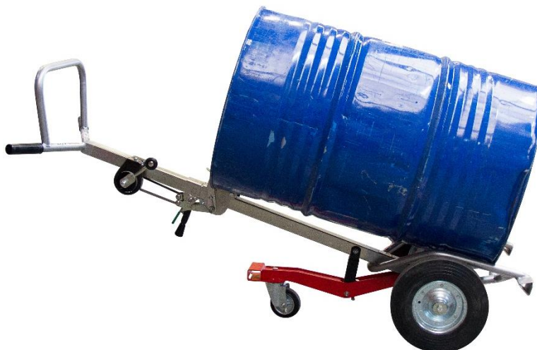
845 008 012 – Simple griffe