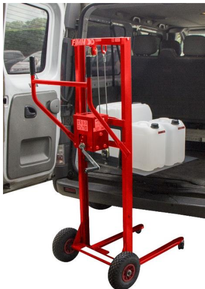
Modèle CU 250 KG roues pneumatiques et option plateau