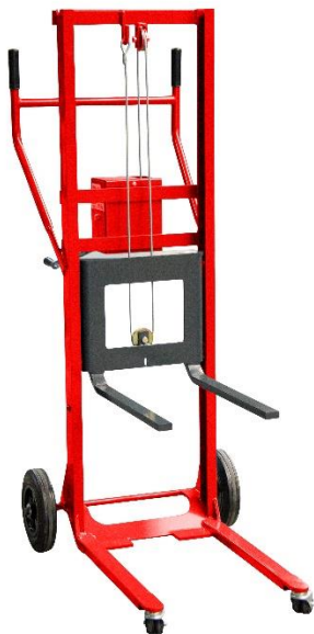
Modèle CU 250 KG Roues Caoutchouc