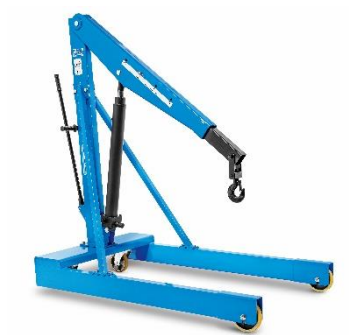
Forme U, fixe