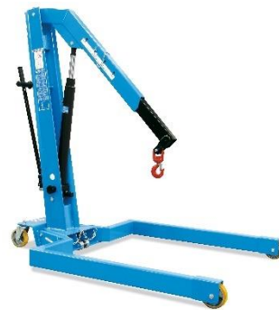
Forme U, pliante