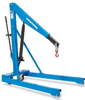
Forme V, fixe