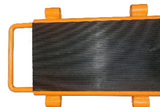
Rouleurs à galets fixes, 2,5 à 6 T