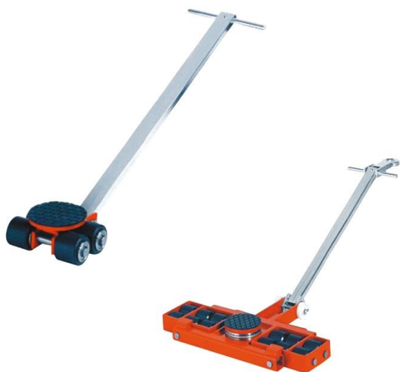
Rouleurs pivotants avec timon, 4 à 16 T